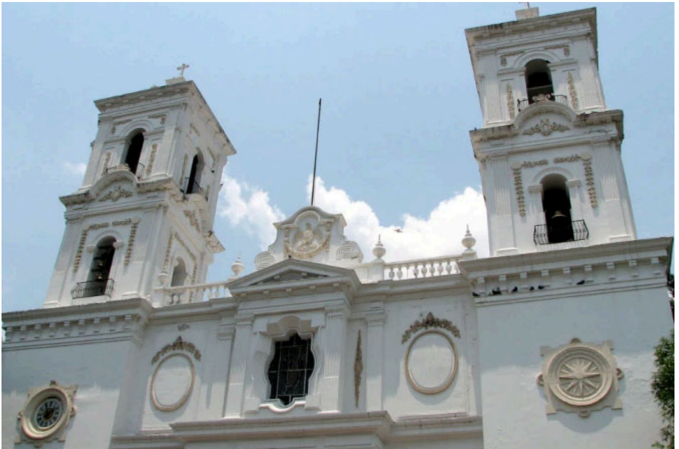
Catedral de Santa María de la Asunción en Chilpancingo.